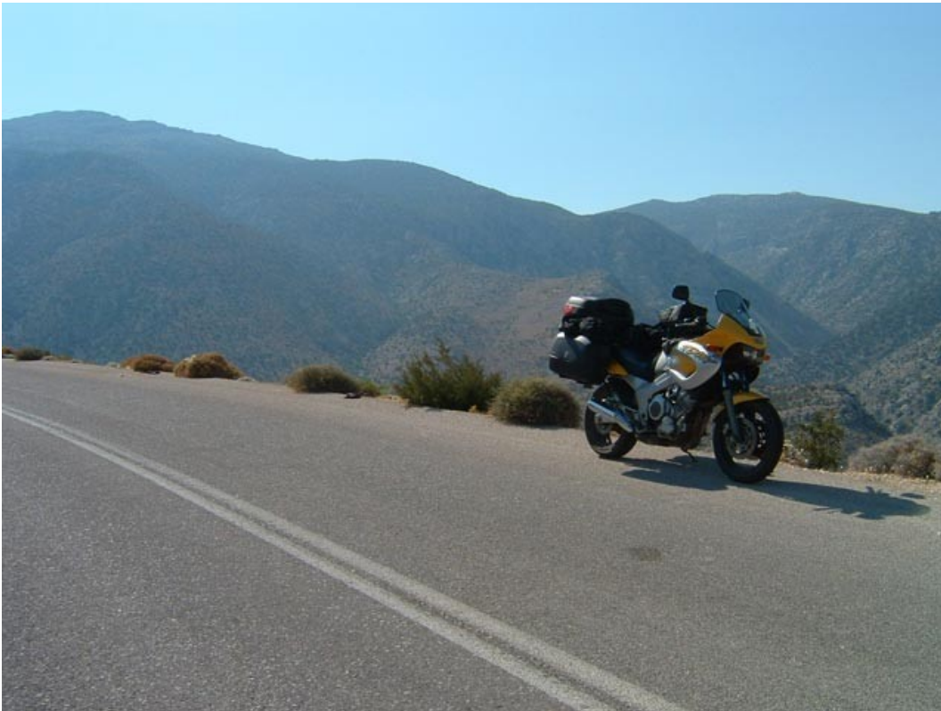
Questa è Elata: